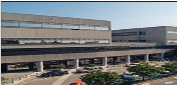
المركز الطبى التا بايتس

عادة ما تكون هذه المناطق مزروعة أمام المدخل الرئيسي مباشرة خارج موقع العام للمستشفى قبل سور المستشفى ، والتي لا يقصد بها استخدامها ولكن لتكون ممتعة بصريا وتعمل لفصل مبنى المستشفى عن الشارع. كما هو موضح فى شكل (2) مثال الذى يوضح المدخل الرئيسى للمركز طبى التا بايتس (Alta-bates-summit-medical-center)