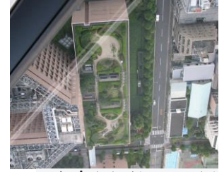
شكل (11) مستشفى الدولي في طوكيو

http:// . Luke's International Hospital in Akashi, Tokyo