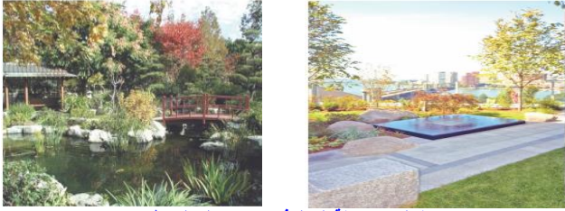
شكل 14 حديقة التأمل في مركز الأمل السرطان

1. Meditation Garden , City of hope Cancer Center , Duarte