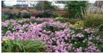
شكل 16 مركز جاثيريا في الولايات المتحدة الأمريكية

يمكن تطوير حديقة الشفاء إلى بعد جديد وهو ان تزرع الأعشاب والنباتات والخضروات الفاكهة جنباً إلى جنب مع النباتات المزروعة المعتادة في مكان يسهل الوصول إليه. هذه "الحديقة الصالحة للأكل" يجب أن تكون بسيطة ومتوازنة، ولكن مصممة في نمط مكرر مع مسارات تجول ترسيم المساحات العامة والخاصة. كما هو موضح في شكل (16) فالغطاء النباتي سيحفز الزيادات السنوية على النباتات المعمرة؛ والحديقة يمكن أن تحتوي على اعداد كبير ومتنوعة من النباتات والزهور الجميلة [14]