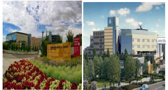
الشكل (18) مستشفى جون ماري في يونان http://hospital.speakbos.site john-muri-hospital-in-walnut-creek

بعض المرافق الرعاية الصحية ذات المساحات المحدودة والميزانيات المحدودة تتميز بوجود الحدائق الصغيرة والمغلقة التي يمكن رؤيتها فقط من داخل البناء . ففي هذه الحدائق تكون تكلفتها قليلة على بعض المساحات الخضراء ويمكن مشاهدتها من المناطق المحمية ومغلقة مثل اماكن جلوس داخلية؛ فهي لا تقدم شيئاً من عناصر للحواس مثل السمع أو الشم عند طريق روائح وغيرها