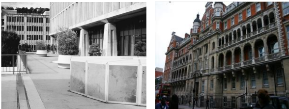
شكل (9) و(10) مركز ديفيد

http://himetop.wikidot.com 2018/5/28 و Center, San Francisco, California Davies Medical