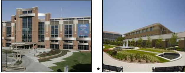
شكل (7) و(8) مستشفى سانت ليكوس

العام مقاعد للجلوس وبرجولات وتبلطيات.. الخ) وعناصر طبيعية (عنصر مائي أو عنصر نباتي مثل الأشجار والزهور والشجيرات) على الرغم من أن الصورة العامة ليست مساحة خضراء ولكنها ممهدة كساحة حضرية كما هو موضح في الشكل (7) و(8).