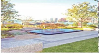
Meditation Garden ,City of hope Cancer Center , Duarte

قادرة على الشعور بالمبادئ التنظيمية للدورة الدموية. توفير الشعور بالثابت والاتجاه ، والتي قد تخفف أيضا طريقة العثور على الطريق ، وخاصة في المستشفيات .