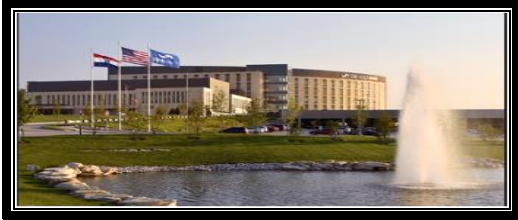
الشكل (1) (مستشفى سانت ماري ، نيويورك ، جزيرة وايت ، إنجلترا)

تعتبر من المساحات المفتوحة الموجودة فى الموقع العام والتي تكون فى الصف الذى يعمل على تكوين المناطق الخضراء المفتوحة بين المباني وبعضها . تستخدم أساسا فى المقام الاول للانتظار وتناول الطعام فيها ، وربط العمارة مع بعضها بمسارات المشي والممرات كما هو موضح فى شكل (1) مثال :- مستشفى سانت ماري الذى يوضح ساحة مفتوحة للمستشفى يوضح تشكل البحيرة والأراضي الطبيعية داخل المستشفى