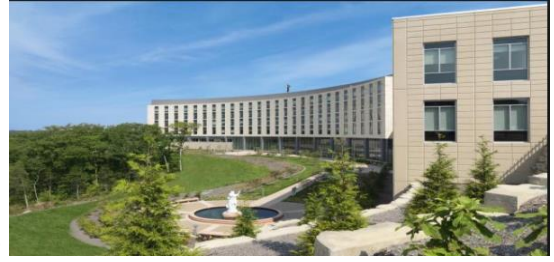
الشكل 17 مستشفى ماري

19Severtsen, Betsy. Healing Gardens, Gardens, 2006; 3. http://www.majorfoundation.org/campaign-for-the-beautiful.htm 6/ 2018