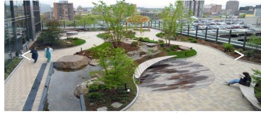
شكل (13) مستشفى سميثو للسرطان