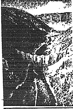
شكل رقم (1)

خريستو - ستارة الولاي - (فن الأرض) - ١٩٧١م. - "كولورادو".